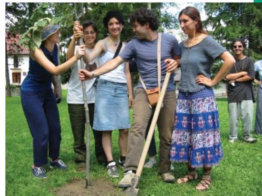
Volonteri kampa u Kosjeriću sade tradicionalno "Drvo prijateljstva"

“Saradnja sa BCIF-om je došla za nas u veoma teškom periodu kada smo prolazili kroz jednu veliku volontersku akciju „Neću baru hoću Taru“... Obuka koju smo prošli i savjete koje smo dobili i sva podrška ne može se meriti veličinom dobijenog granta, ona je mnogo veća...”