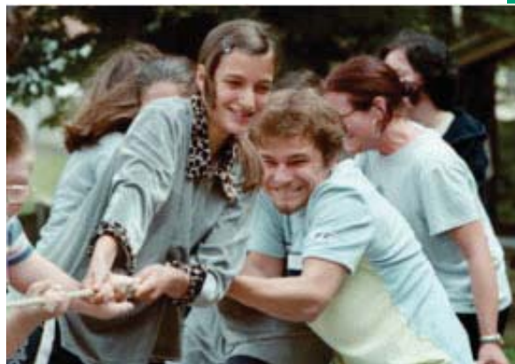
Udruženje Dečije srce organizuje aktivnosti za decu sa invaliditetom

Kroz Programe donacija podržavamo neprofitne inicijative i udruženja građana koje pokreću rešavanje problema na kretivan i efikasan način, uključuju sugrađane/ke u rešavanje problema i koriste lokalne resurse i potencijale. Trudimo se da naša kancelarija i mreža saradnika/ca u svim regionima Srbije i Crne Gore uvek budu otvoreni za nove ideje, da budemo dostupni i najmanjim zajednicama u manje razvijenim regionima, da se oslanjamo na mišljenja i stavove ljudi iz zajednice i pomognemo im u definisanju problema i predloženog načina rešavanja. Finansijska pomoć u programima donacija kreće se od 3.000,00 do 8.000,00 evra, zavisno pre svega od programa, odnosno vrste problema koji se rešavaju. Predloge projekata prihvatamo na jezicima različitih etničkih grupa koje žive u Srbiji i Crnoj Gori, uključujući albanski, mađarski i romski. Svaku dodeljenu donaciju prate konsultacije sa korisnicima od početka realizacije projekta do podnošenja završnog izveštaja.